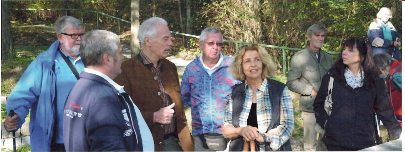
Schwarzenfeld/Oberpfalz: Zahlreiche Wanderer, in der Mitte die Schauspielerin Michaela May, nahmen teil.

me zeigten ihre herbstliche Farbenpracht in Gelb, Orange und Feuerrot. In 25 Städten und Gemeinden organisierten Mitgliedsvereine des Deutschen Volkssportverbandes (DVV) Wanderungen. Bereits zum 20. Mal fanden die Benefiz-Wandertage „Deutschland wandert – Deutschland hilft“ statt, und bislang sind schon mehr als 250.000 Euro für Mukoviszidose-Patienten zusammengekommen. Das Geld stammt aus dem Startkartenverkauf sowie aus den Spenden der ausrichtenden Vereine und weiterer Gönner.